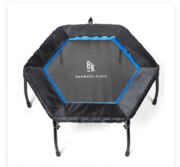
Hexagon-Form Für gezieltere Übungen