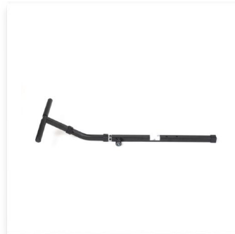
mit Haltestange Abnehmbar