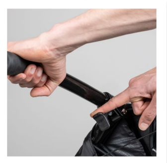
mit klappbaren Füßen