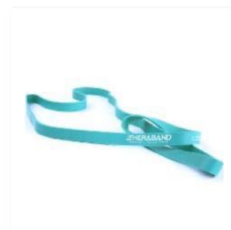
Mittel Grün | 11kg