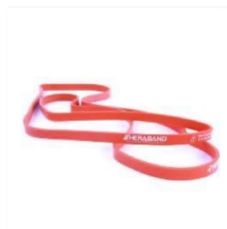
Leicht Orange | 7kg