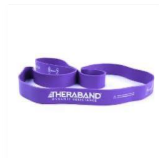
Extra schwer Lila | 23kg