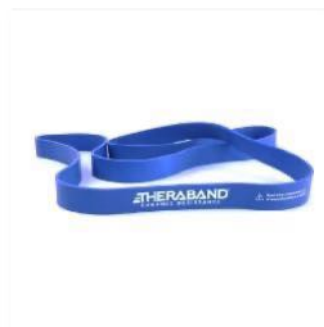
Schwer Blau | 16kg